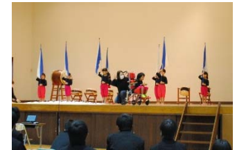
和太鼓でエールを送るこがね保育園児

同校では「地域の力を学校に、学校の力を地域へ」を掲げ、さまざまな教育活動をし地域と共にある学校づくりに取り組んでいる。